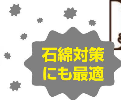
壁面穴あけ作業時の粉塵受け