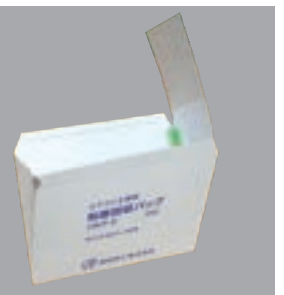
正面から見た装着画像