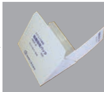
右側から見た装着画像