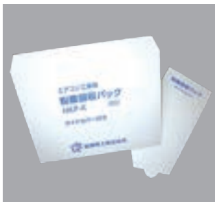
本体とサイドカバー