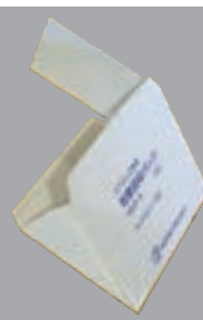
左側から見た装着画像